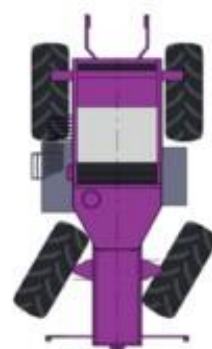
Только задними колесами